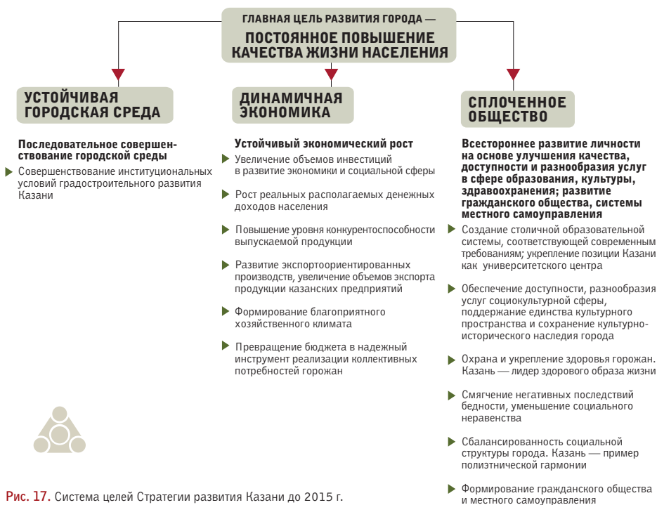
Рис. 17. Система целей Стратегии развития Казани до 2015 г.