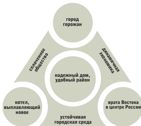
Рис. 16. Основные стратегические направления и проекты Стратегии развития Казани до 2015 г.