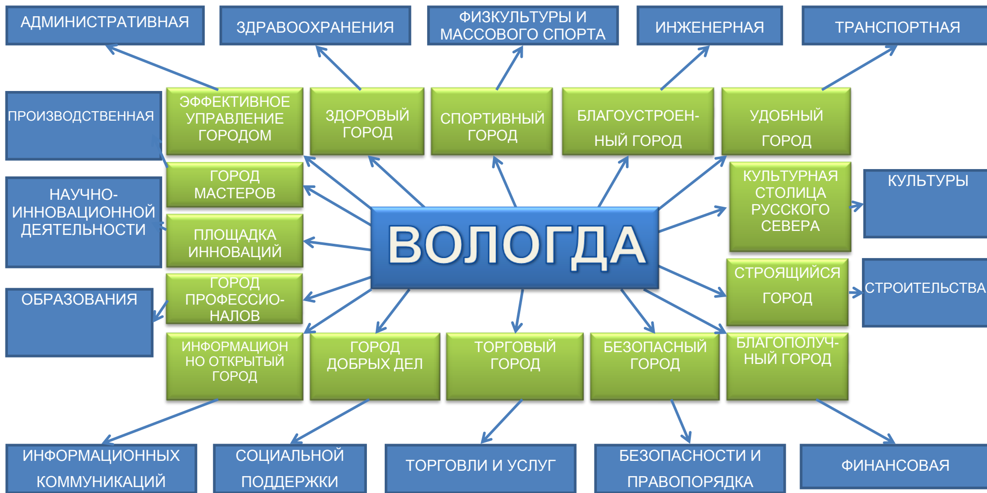
Рис. 1. Сопоставление стратегий развития города с инфраструктурами